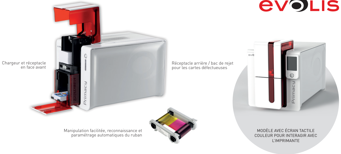
Chargeur et réceptacle en face avant